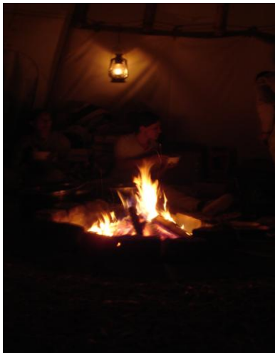
kochen und backen