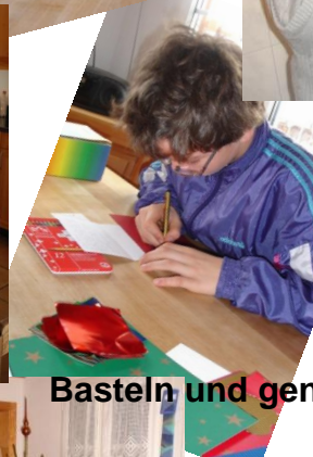
Basteln und genießen den Winter